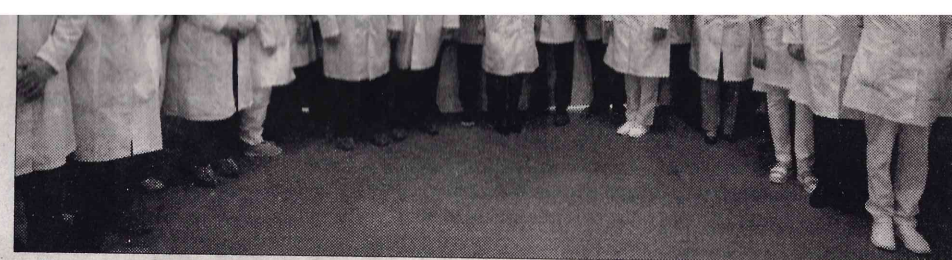
■ Гости, строители и персонал госпиталя

Безусловно, на данный момент госпиталь – помощь для борьбы с коронавирусом. Но потом – это помощь для лечения самого разнообразного спектра болезней. И этой цели, надеюсь, мы достигли. Когда возникает угроза жизни и здоровью людей, мы можем мобилизоваться и быстро, компетентно, качественно строить такие очень нужные объекты, – отметил Радий Хабиров. – В этом году, кроме ковид-госпиталей