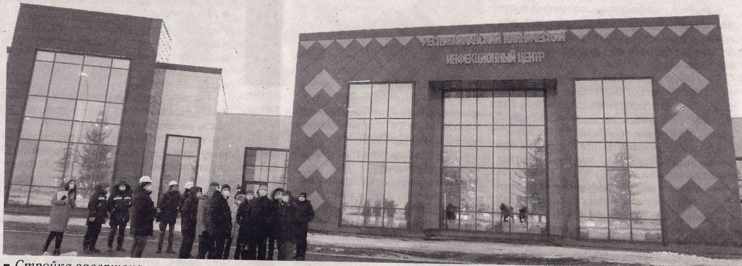
■ Стройка завершена

Дорогие читатели! Продолжается подписка на газету «Стерлитамакский рабочий»