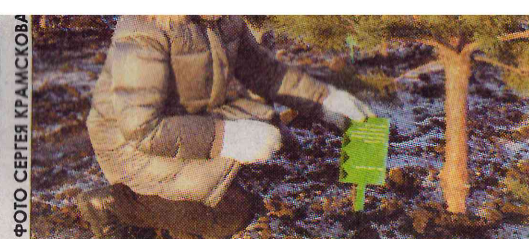
■ Сосны в честь медиков