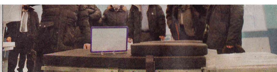
■ Гости осматривают новое оборудование