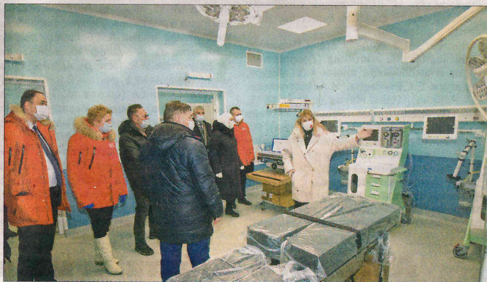
■ В родильном отделении

— Сегодня мы закладываем аллею Здоровья, аллею медиков, и это — не случайность, — отметил Радий Хабиров. — Главное в нынешних условиях — оказать поддержку врачам и системе здравоохранения в целом. Для этого мы принимали такие нестандартные решения, в кратчайшие сроки построили два инфекционных госпиталя.